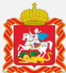
Правительство Московской области